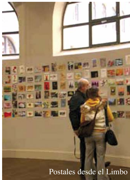
Postales desde el Limbo